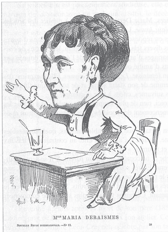
Maria Deraismes caricaturée par Gill.

Maria Deraismes, toutefois, compte tenu de son état de santé (crises d'emphysème), se réfugie chez une tante en Bretagne. Au lendemain de Sedan, le 4 septembre, elle prend officiellement position pour la République.