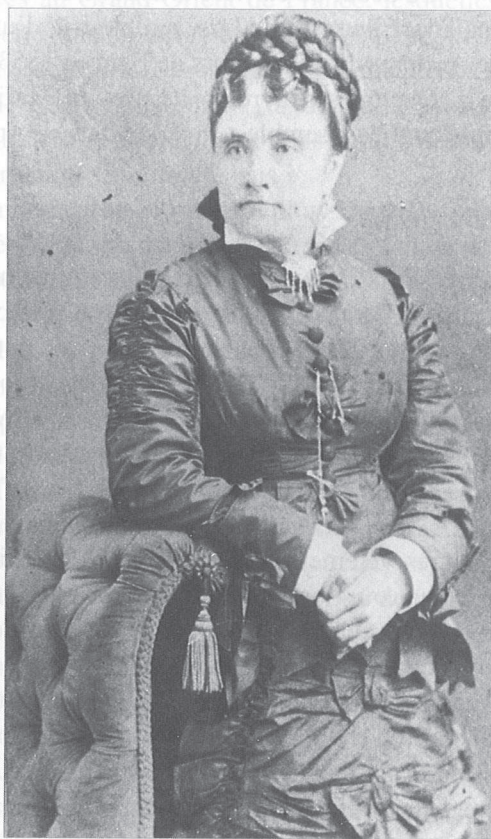
Maria Deraismes jeune.

Elle aborde les philosophes tels que Leibnitz, Hobbes, les philosophes anglais et allemands du XVIII e siècle. Elle apprend le grec et le latin pour lire les Anciens dans le texte. Quelques années plus tard, elle est attirée par la philosophie d'Auguste Comte, mais, déçue, elle va combattre le positivisme « avec une énergie plus intuitive que rationnelle ».