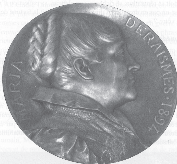
Médaillon surmontant la tombe de Maria Deraismes.

On peut aussi se recueillir sur la tombe de Maria Deraismes, au cimetière Montmartre. Cette pierre tombale est surmontée d'un médaillon, dû au sculpteur Daniel Dupuis, la représentant de profil.