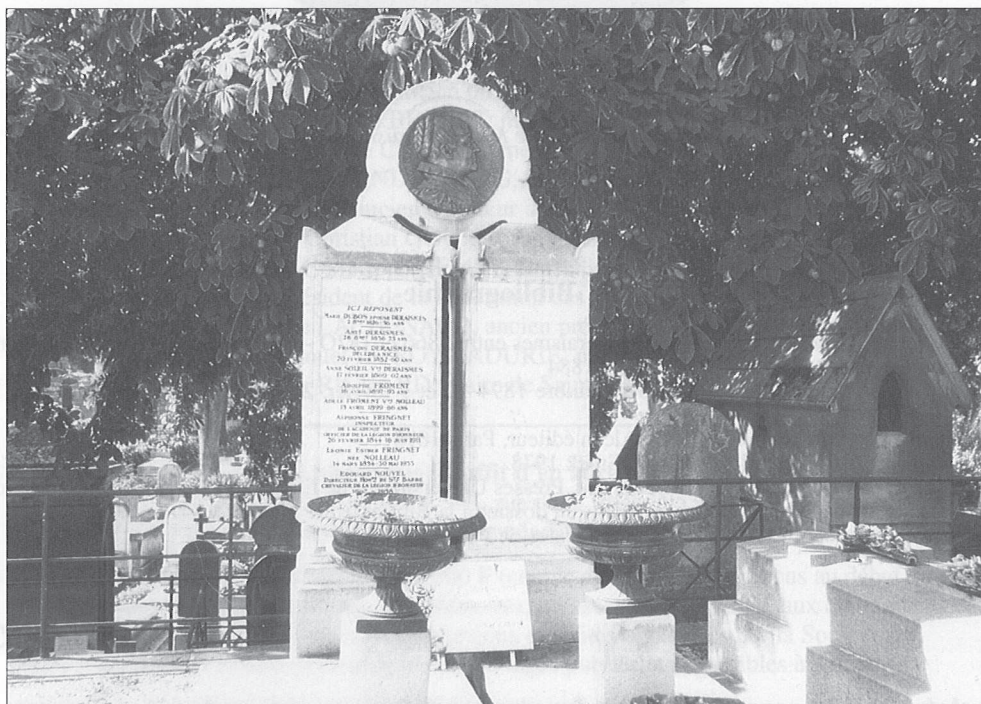
La tombe de Maria Deraismes, au cimetière Montmartre.