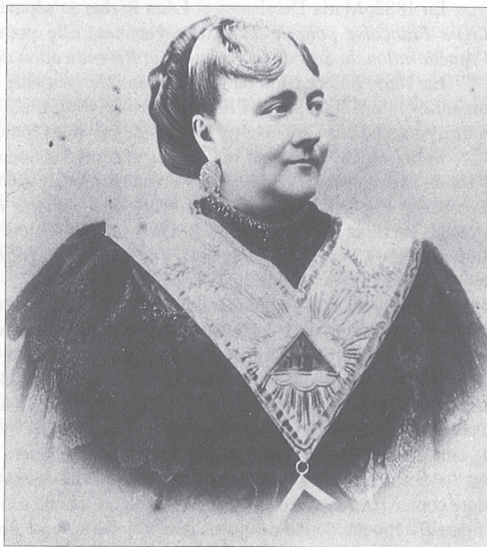
Maria Deraïmes, décorée du cordon de Maître.

Cependant, si Maria Deraïmes juge inopportun de présenter sa candidature aux élections législatives, elle s'apprête en revanche à demander son admission dans la Franc-Maçonnerie, ce qui constitue une sorte de révolution.